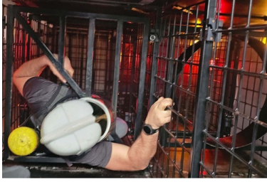
Przeszkolenie w zakresie ochrony przeciwpożarowej w realnych warunkach pożaru na jednostce pływającej SG