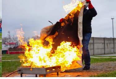
Ćwiczenia z zakresu gaszenia pożaru przy pomocy koca gaśniczego