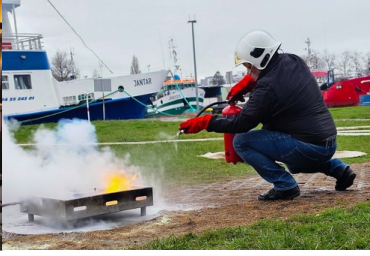
Uczestnik szkolenia w kasku ochronnym i rękawicach gaśniczych gasi płomień na otwartej przestrzeni