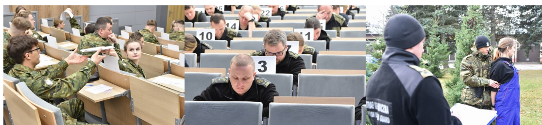
Funkcjonariusze SG przekazują arkusze egzaminacyjne w swoich rzędach