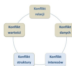
Rodzaje konfliktów wg Moore'a

Konflikty w relacjach służbowych mają często charakter niejawni!